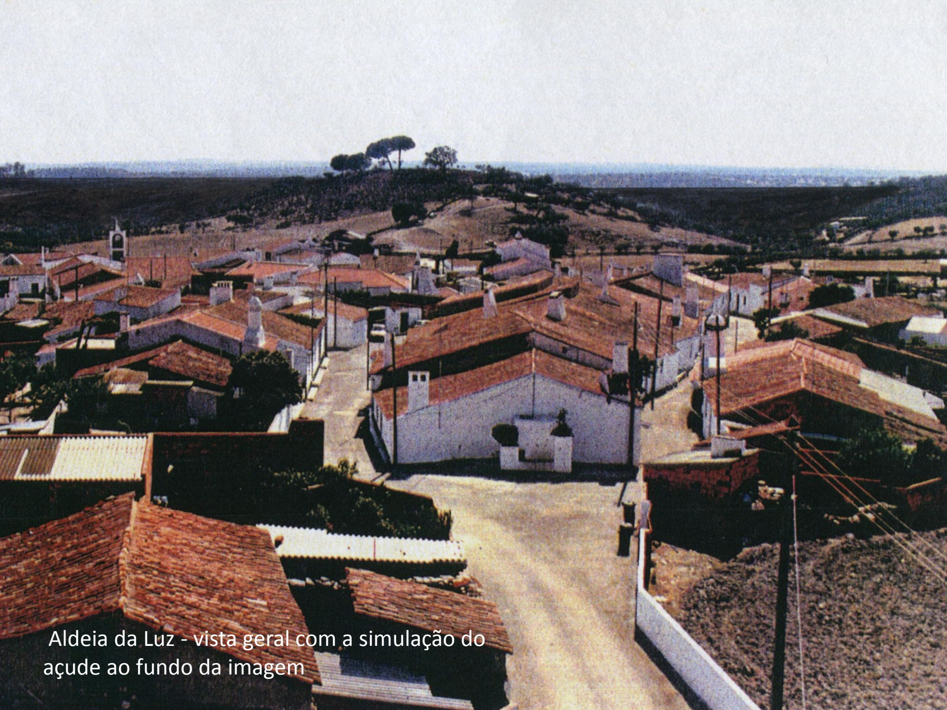
Aldeia da Luz - vista geral com a simulação do açude ao fundo da imagem