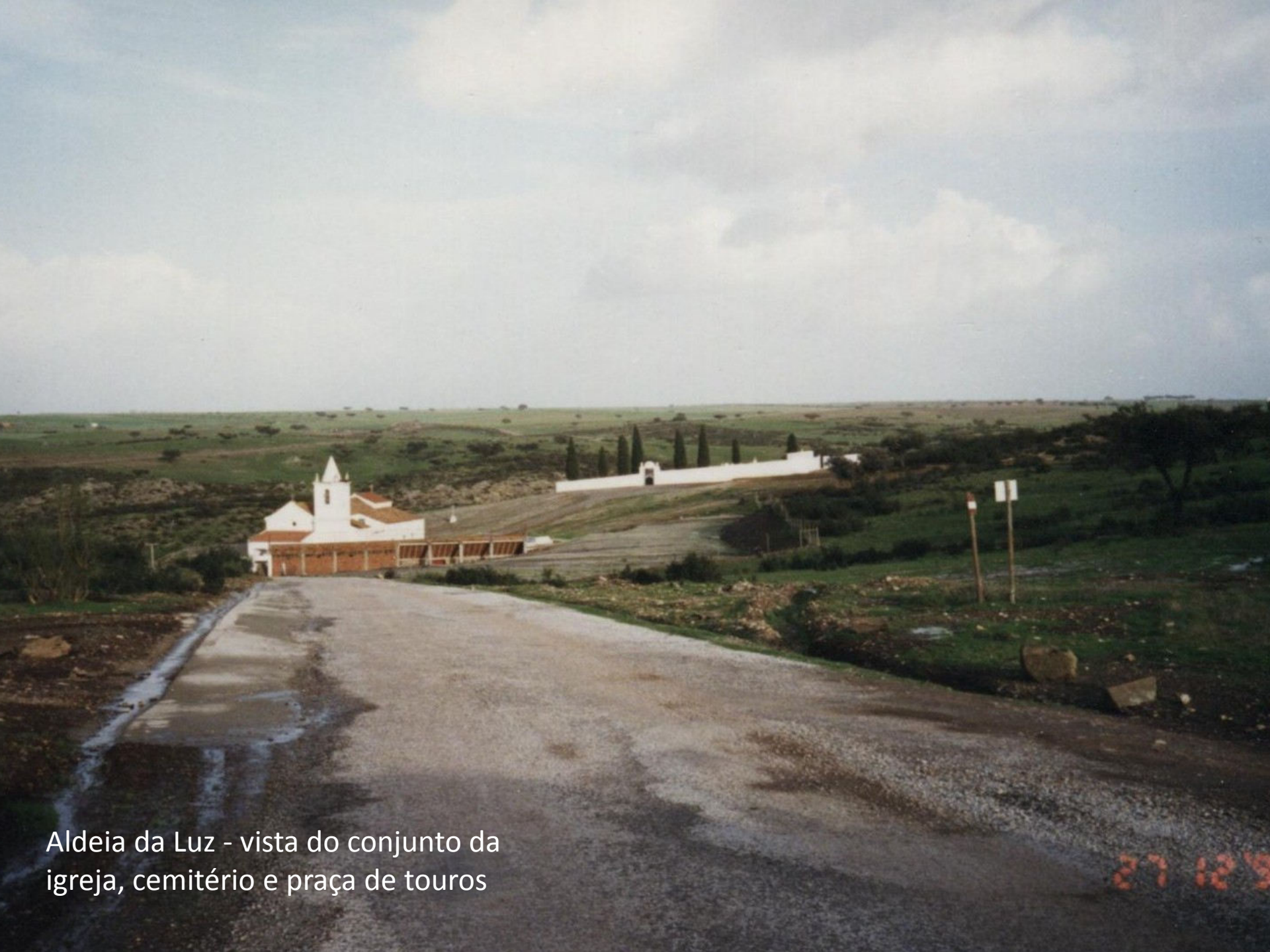
Aldeia da Luz - vista do conjunto da igreja, cemitério e praça de touros