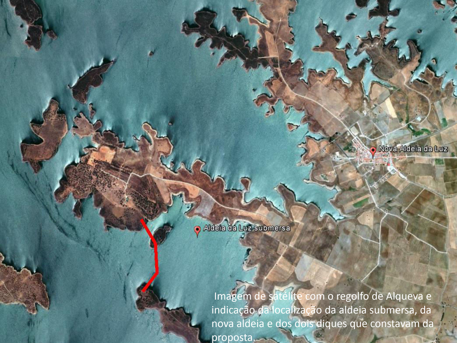
Imagem de satélite com o regolho de Alqueva e indicação da localização da aldeia submersa, da nova aldeia e dos dois diques que constavam da proposta.