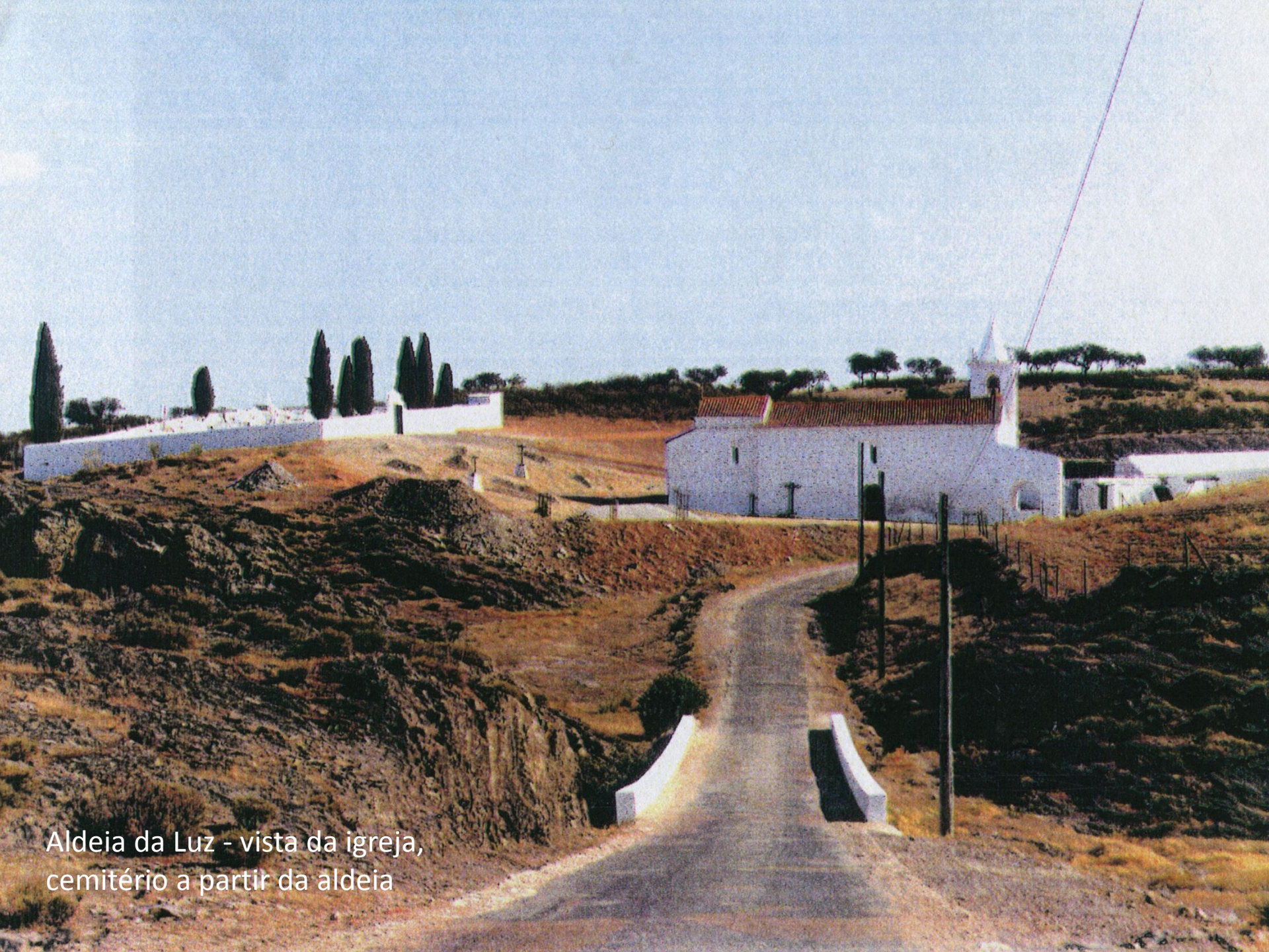
Aldeia da Luz - vista da igreja, cemitério a partir da aldeia