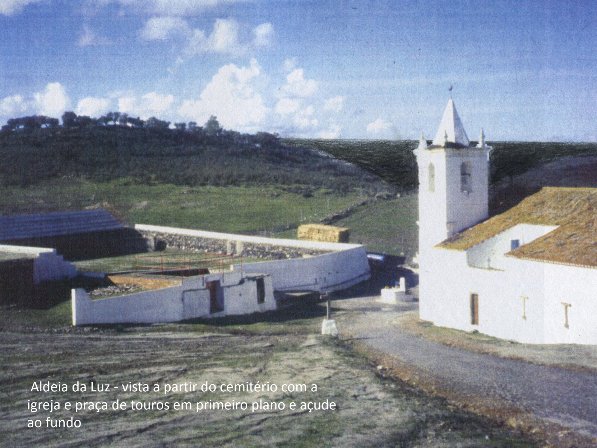
Aldeia da Luz - vista à partir do cemitério com a igreja e praça de touros em primeiro plano e açude ao fundo