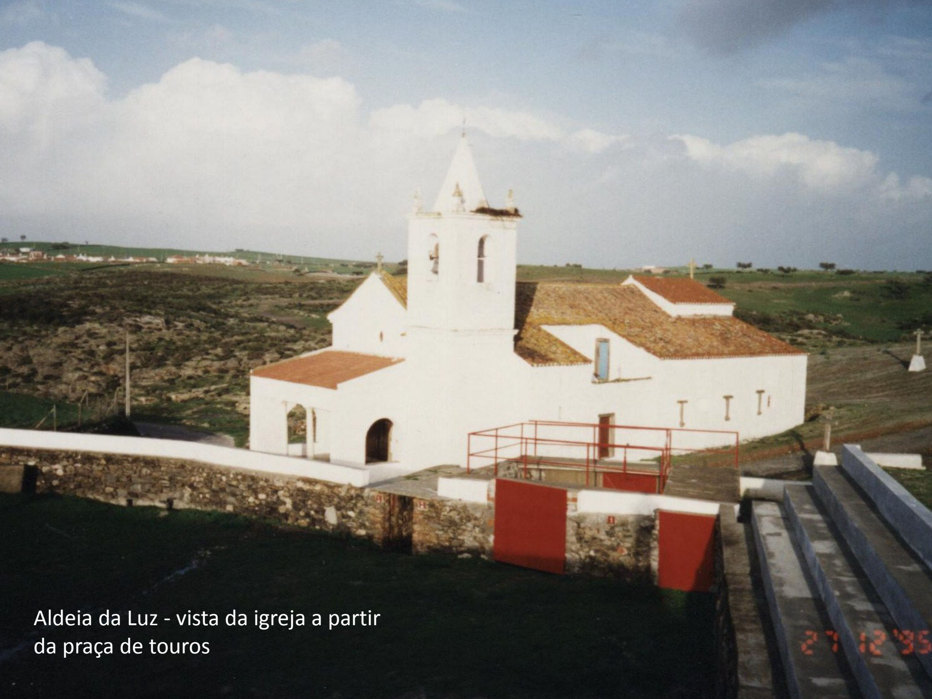
Aldeia da Luz - vista da igreja a partir da praça de touros