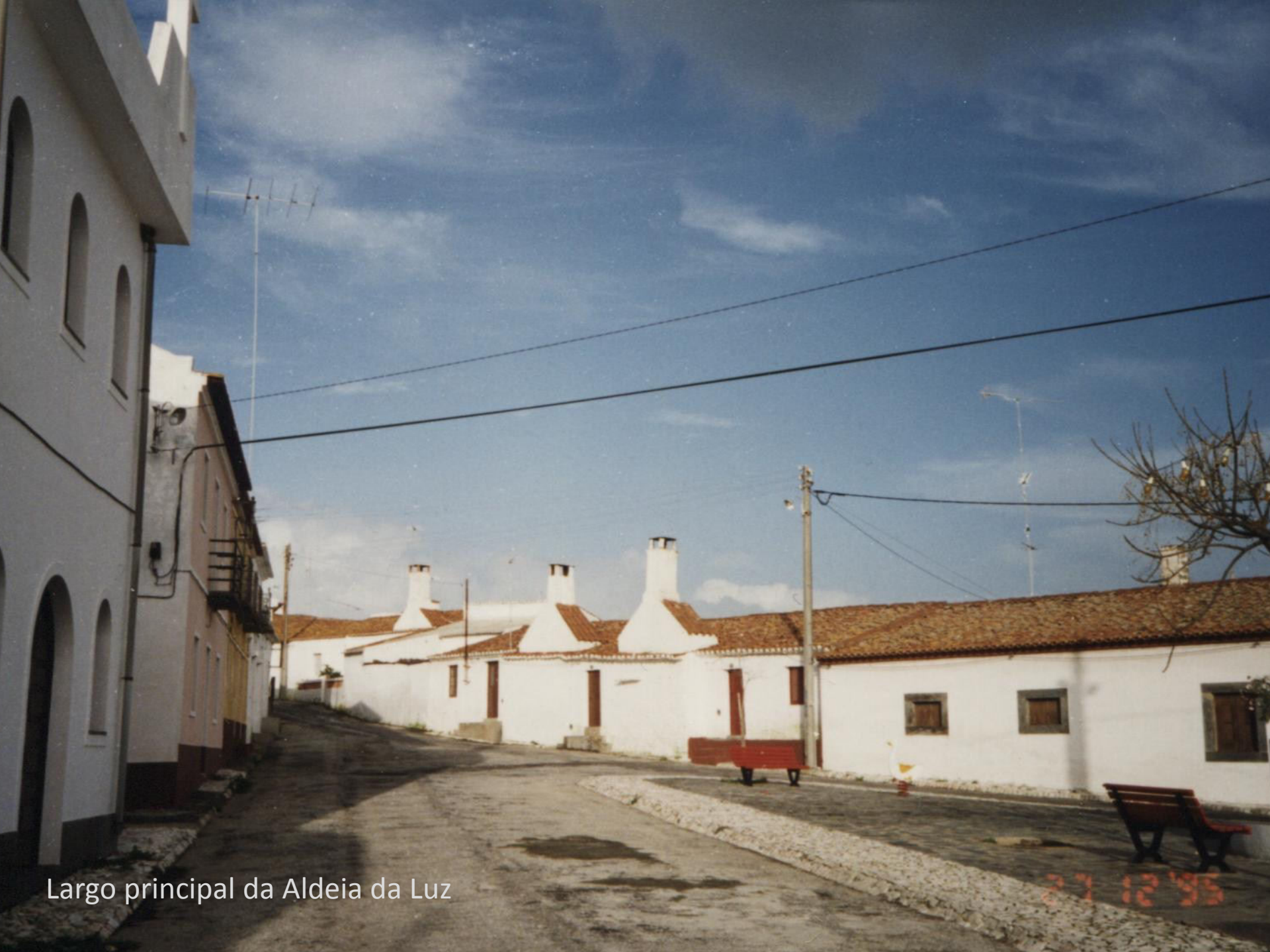
Largo principal da Aldeia da Luz